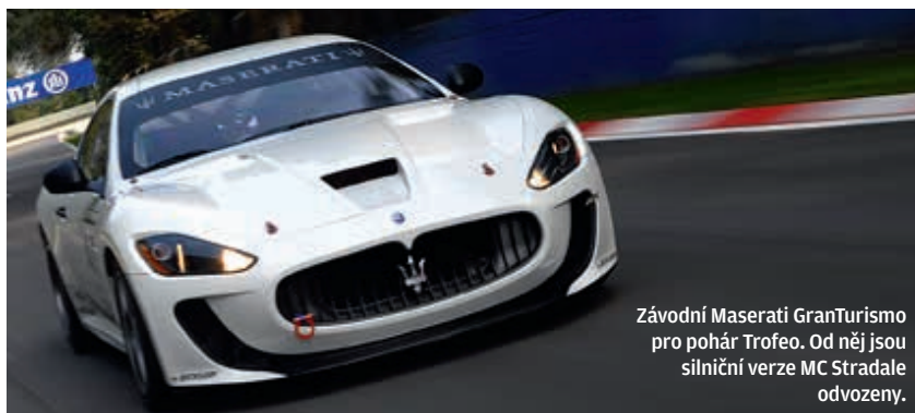
Závodní Maserati GranTurismo pro pohár Trofeo. Od něj jsou silniční verze MC Stradale odvozeny.

Lehkost a divokost, kterou cítíte ve volantu, intenzivním způsobem doplňuje také motor. Atmosférický osmiválec vznikl v mnoha verzích (viz samostatný box) a v této aplikaci jde o typ s největším objemem 4,7 litru a výkonem naladěným na 460 koní. Když se řekne atmosférický motor, právě tento osmiválec by měl být první, který vás napadne. Je to úžasná věc s plochou klikovou hřídelí a nezaměnitelným zvukem, projevem i emocemi. Patří k těm motorům, u nichž je poměrně těžké propracovat se k jejich omezovači – tedy bavíme-li se o sportovní jízdě pod plným plynem. Poslední jeden až dva tisíce otáček