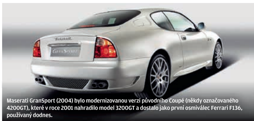
Maserati GranSport (2004) bylo modernizovanou verzí původního Coupé (někdy označovaného 4200GT), které v roce 2001 nahradilo model 3200GT a dostalo jako první osmiválec Ferrari F136, používaný dodnes.